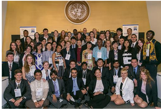
2014 Many Languages, One World コンテスト受賞者の皆

エッセイ提出の締め切りは、アメリカ東部標準時の2015年3月25日水曜日午後11時59分です。